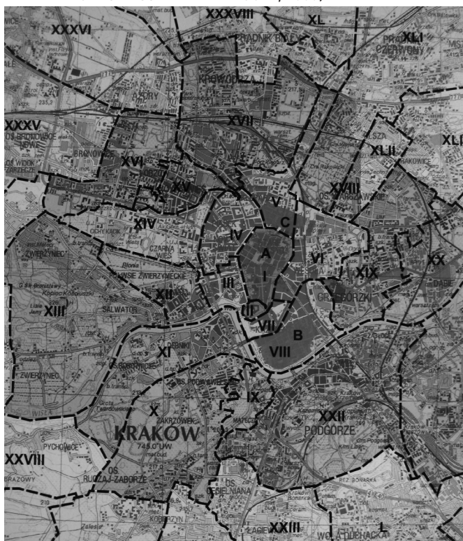
Ілюстр.3 Розвиток міської території Кракова у XIII–XX ст.; фрагмент карти (див.: Kraków // Atlas Historyczny Miast Polskich. – Т.5: Małopolska. – Kraków, 2008)