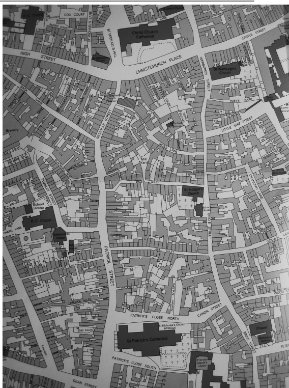
Ілюстр.2 План Дубліна за кадастром 1846–1847 рр.; фрагмент карти (див.: Dublin, part 2: 1610 to 1756 // Irish Historic Towns Atlas. – №19. – Dublin, 2008)