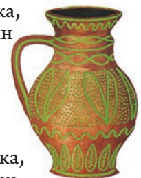
Глечик, село Бубнівка, повіт Гайсин