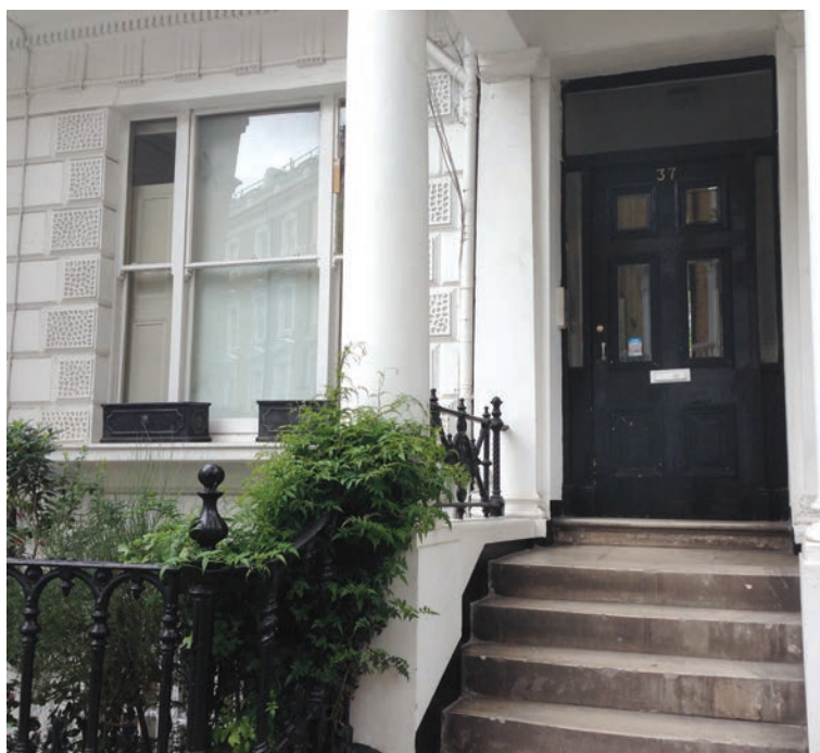
У кімнаті нижнього поверху цього будинку мешкав Вадим Щербаківський. 37 Linden Gardens, London W2.

та князем Яном Токаржевським-Карашевичем поділився споминами про відомого історика, громадського і державного діяча, якого знав ще з Києва, разом працював в УВУ в Празі та Мюнхені 29 .