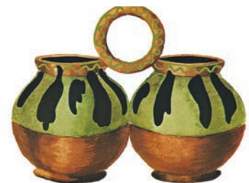
Близнюки, село Бубнівка, повіт Гайсин