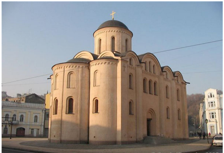
Фото 3. Церква Богородиці Пирогощої на Подолі, м. Київ

А негативний приклад Багато критикували за те відтворення Золотих Воріт, яке є зараз. Дуже багато я чув критики від колег за кордоном, мовляв це дуже неправильно було реставрувати таким чином пам'ятку археології. Ніхто не знав, що там було зверху, чи була чи не була церква, ніхто не фотографував, не малював. Були аналоги якісь. І відтворювали це все по аналогам, тому що хотіли в центрі мати таке.