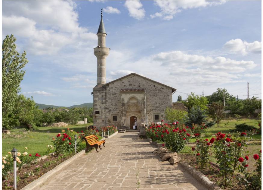
Фото 5. Мечеть хана Узбека у Старому Криму

Т. В.: Який останній був великий проект?