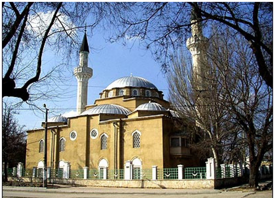
Фото 4. Мечеть Джума-Джамі в Євпаторії

А.: Багато. Ми реставрували і мечеть Джума-Джамі в Євпаторії (фото 4), і кенаси, і турецькі бані. Відреставровано і Лівадійський палац, і фортецю у Судаку. Мечеть хана Узбека у Старому Криму (фото 5) – це теж наша робота.