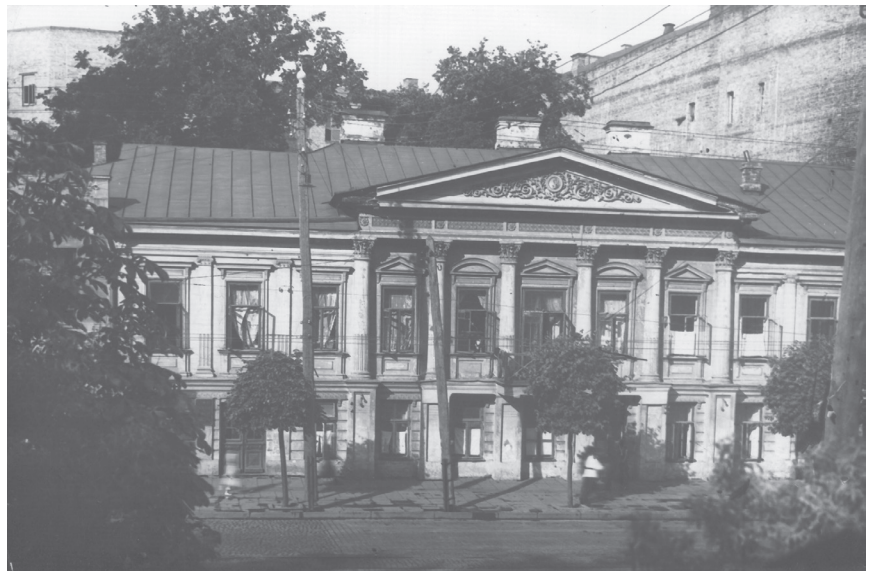
Будинок В. Гербеля. Фото середини 1930-х рр.

Наприкінці 1837 року будинок генерал-лейтенанта Гербеля винайняла адміністрація Університету св. Володимира для розташування незаможних студентів. Окрім мурованого двоповерхового будинку винаймалися дерев'яний флігель та служби, які знаходилися на території садиби. Плата за оренду приміщень становила