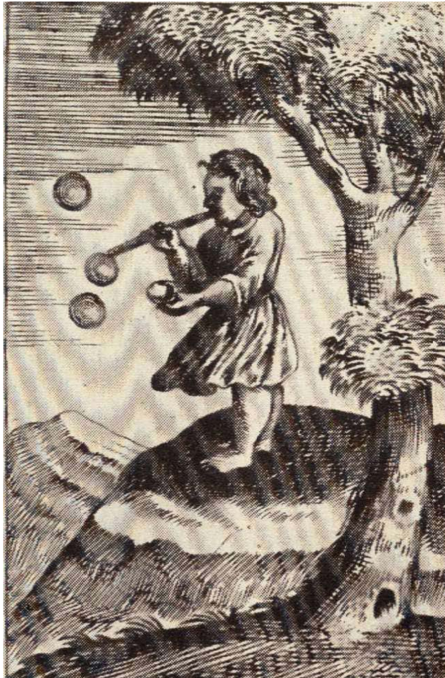
Ілюстрація до книги «Ифіка ієрополітика». 1760 р.