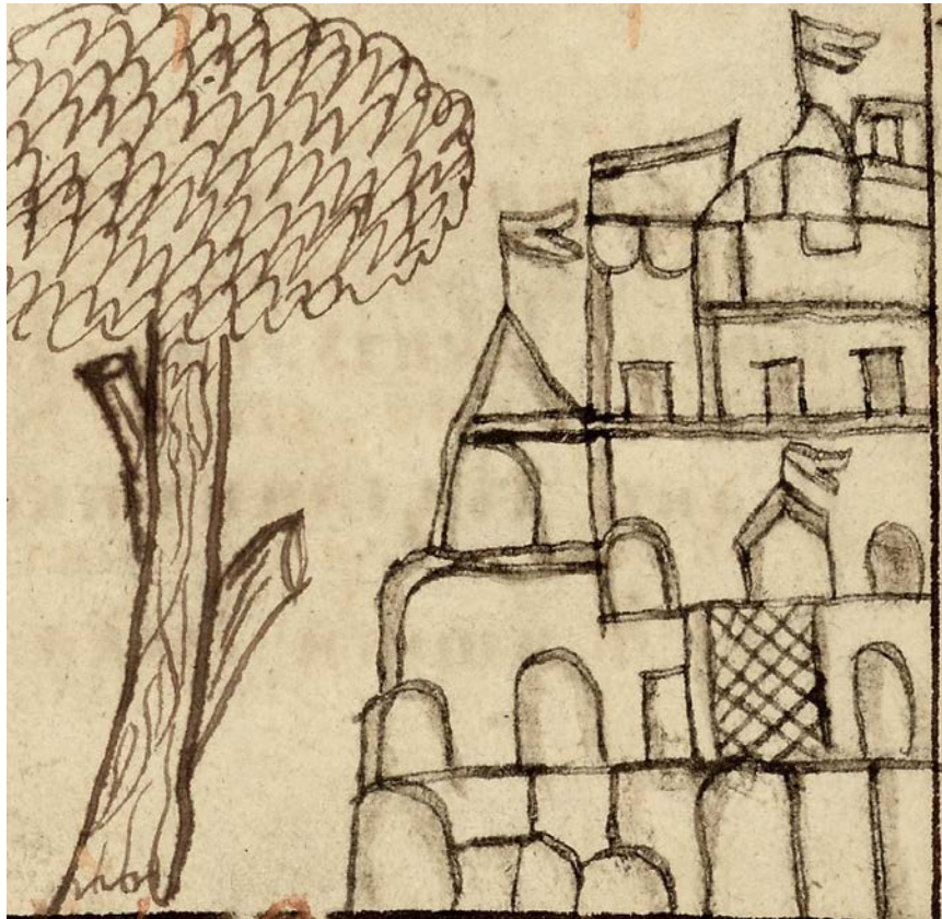
«Град Куземин» – фрагмент аматорського малюнку 1726 р. ЦДІАК України. Ф. 127. Оп. 1012. Спр. 12.

отримували 2–3 руб.). Принаймні у Стародубі рекорд належав чотирнадцятирічній Устині: «Работница родимка стародубовская мещанского звания Устинья нанимается в год за 1 р 20 к на одежи и харче хозяйском» 49 .