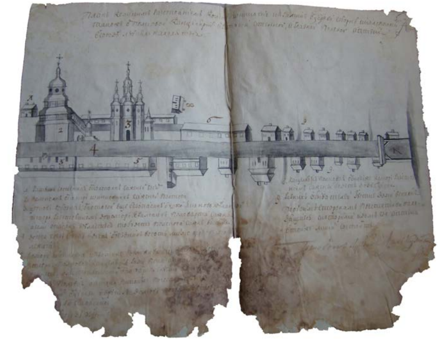
Малюнок-схема головної вулиці м. Лубни. 1758 р.