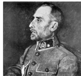
Портрет генерал-поручика Армії УНР Володимира Сінклера, виконаний на початку 1920-х рр. (портрет зі збірника «За Державність»).

«Отаман Генерального штабу прохає Вас прибути ГУГШ (до Головного управління Генерального Штабу. – Я. Т.) по справі призначення на посаду» 3 .