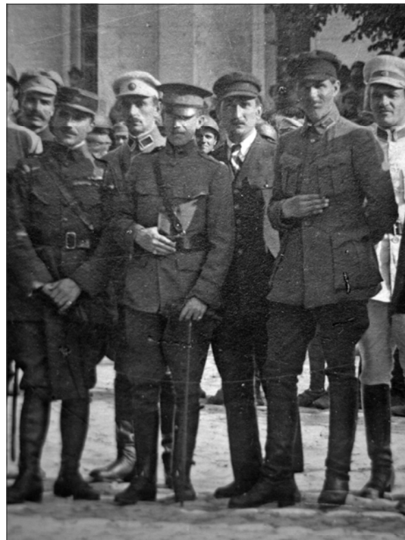
Французький капітан Бомон, невідомий, англійський полковник Фрітч, французький старшина (?), командувач Дієвою армією УНР В. Тютюнник.