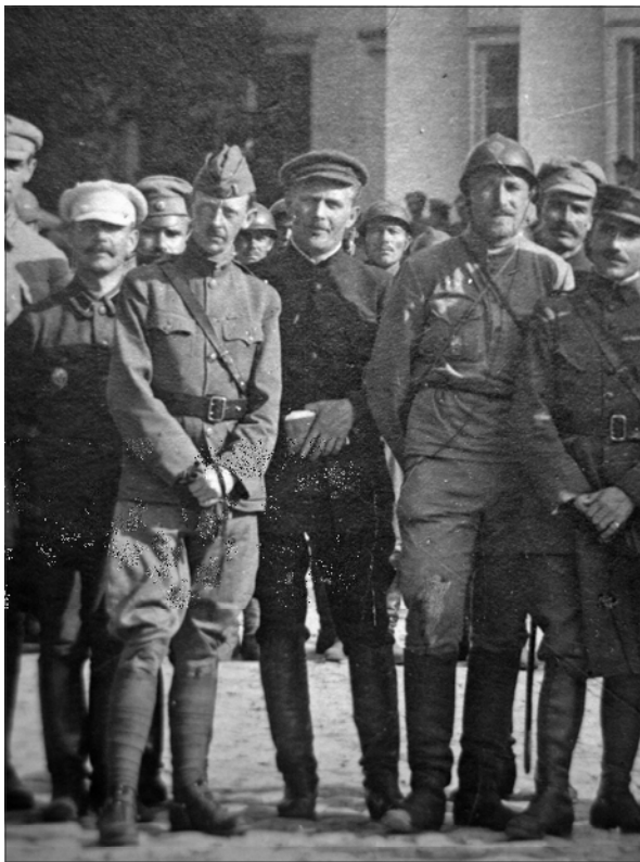
Полковник М. Капустянський, підполковник армії США Лінстрон, невідомий, військовий міністр УНР В. Петрів, французький капітан Бомон (фрагмент фото з Кам'янець-Подільського державного історичного музею-заповідника).