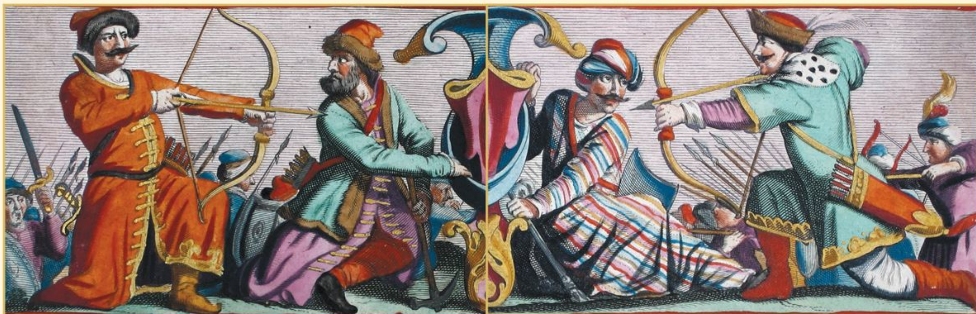
Представители Речи Посполитой, Крымского ханства и Московского государства на «Карте русла Днепра от Черкасс до Днепровского лимана».

РГАДА. Ф. 192. Оп. 1. Атласы земные. В-8. Ч. 2. Л. 83 об.