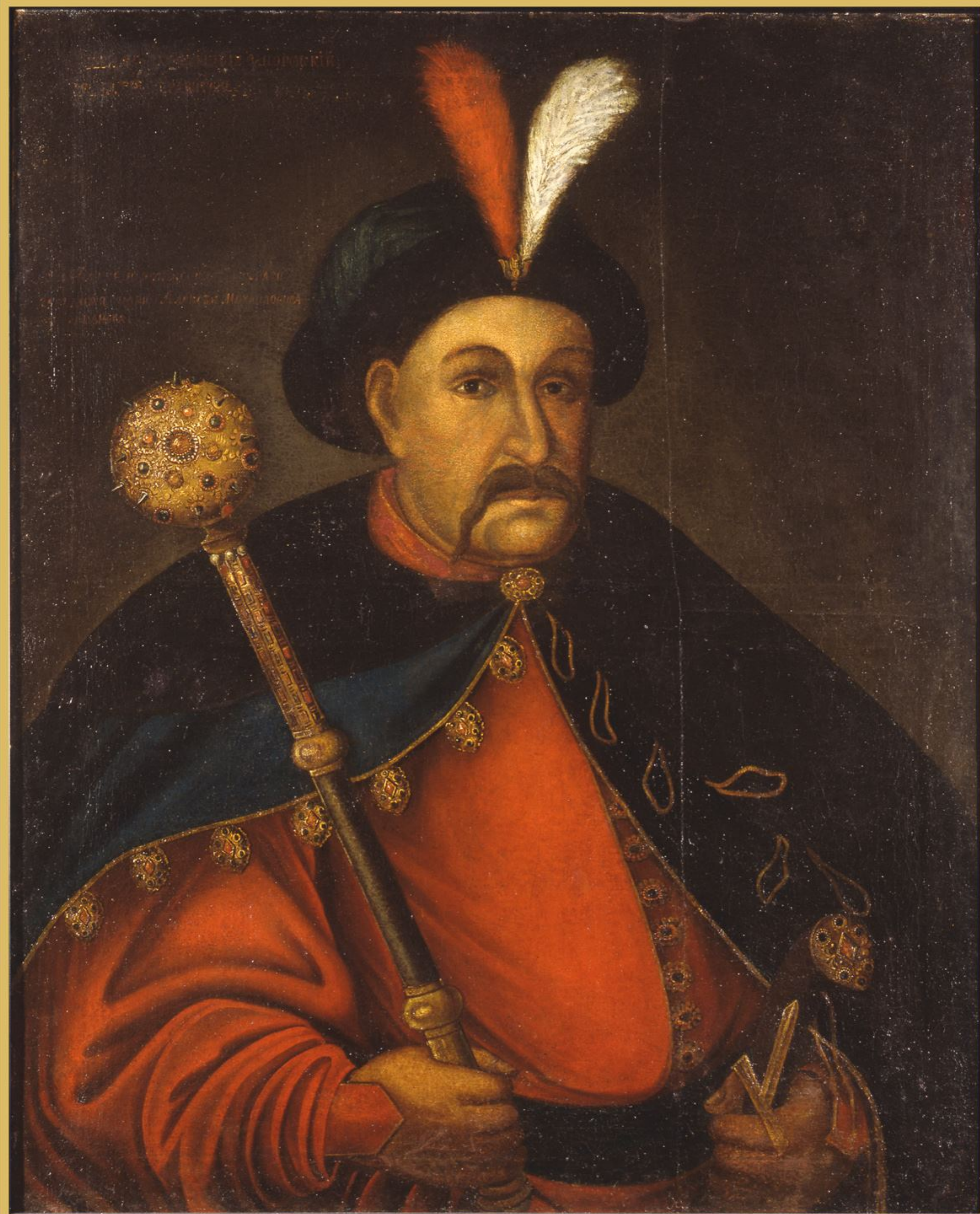
Неизвестный художник. Портрет Богдана Хмельницкого. 1-я пол. XVIII в. Копия с гравюры В. Гондиуса. Холст, масло. ГИМ. 54687 III 296.