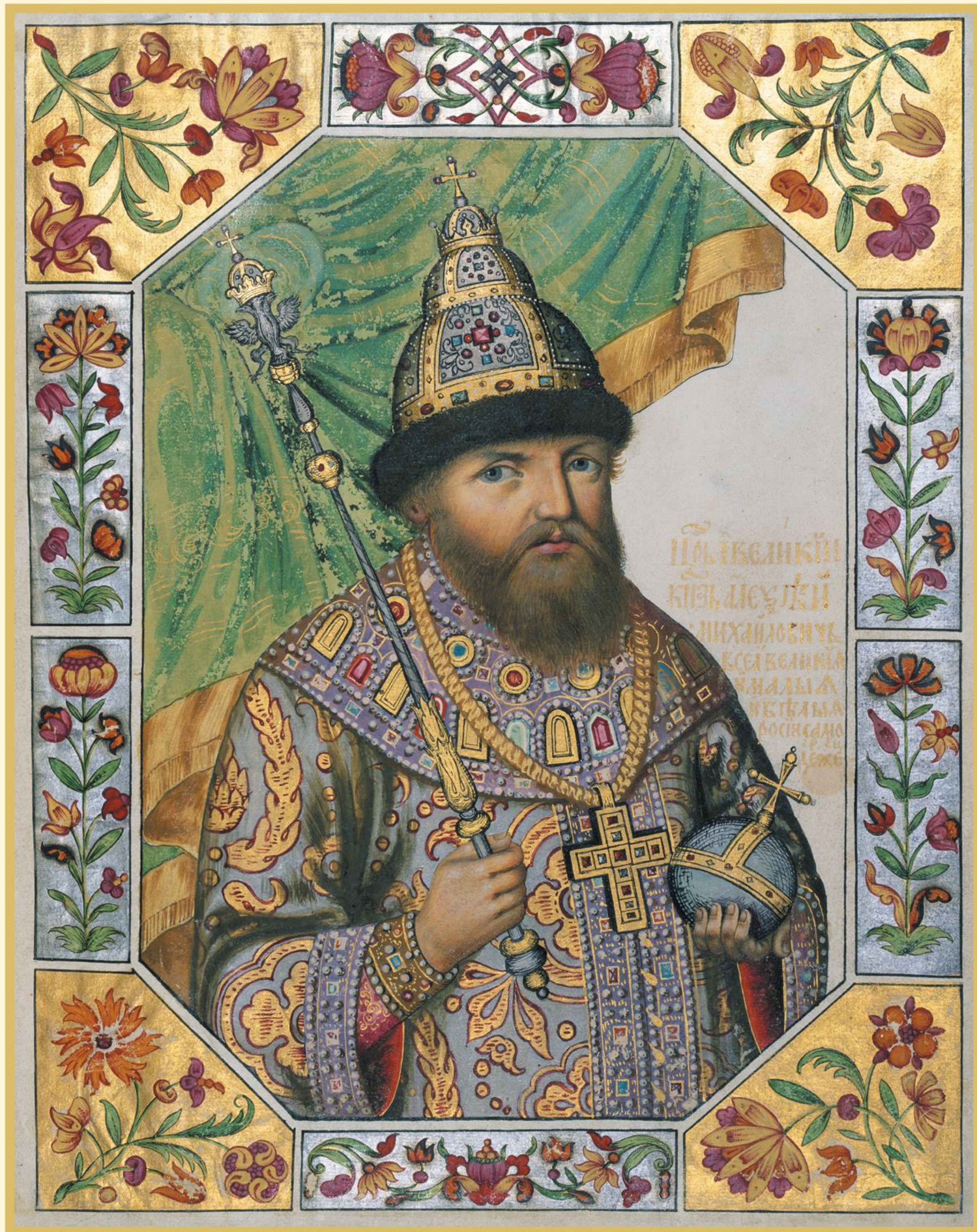
Портрет царя Алексея Михайловича. Из «Большой государственной книги» (Титулярника) 1672 г. РГАДА. Ф. 135. Отд. V. Рубр. III. Ед. хр. 7. Л. 41.